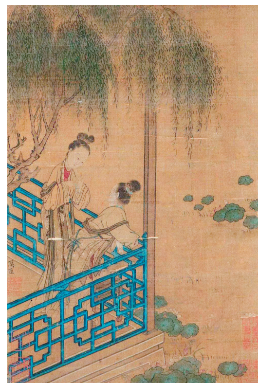
荷塘消暑图(国画) 宋 苏汉臣