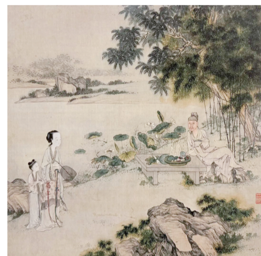
莲塘纳凉图(国画) 清 金廷标 上海博物馆藏

翻开中国历史上的消暑画卷,亭台水榭间的莲塘清韵始终是最富诗意和意蕴的。从宋代《荷亭消暑图》到清代《莲塘纳凉图》,古人以笔墨定格的不仅是生活场景,还是他们独到的生活追求。