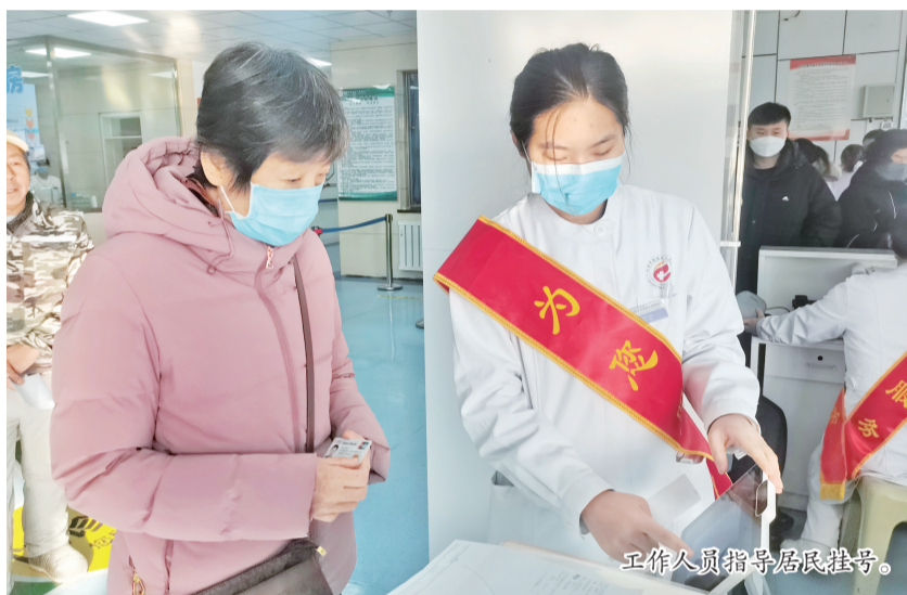
工作人员指导居民挂号。