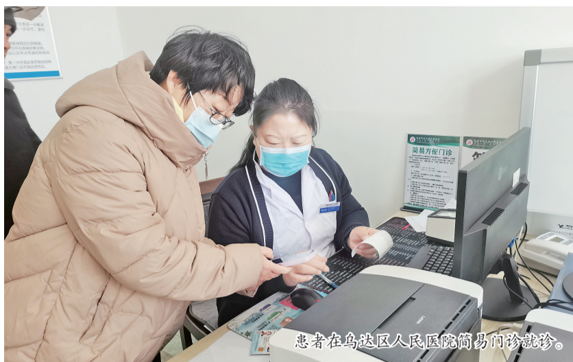
患者在乌达区人民医院简易门诊就诊。

乌达区进一步加强疾病预防,截至目前,全区食源性病例报告221例;传染病疫情报告及时报告率达99.24%;艾滋病防治完成自愿咨询检测280人次,抗病毒治疗率达94.92%;辖区结核病患者应随访管理18例,管理率达100%;生活饮用水监测完成相关任务,枯水期总合格率达86.67%,优于去年;病媒生物密度均控制在标准范围内;卫生监督执法落实“三项制度”,查处11起案件,罚款33040元。