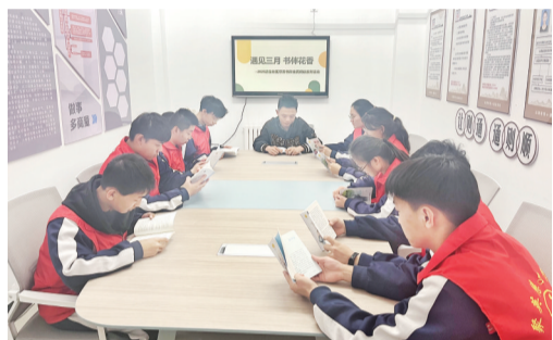
辖区青少年参加读书活动。