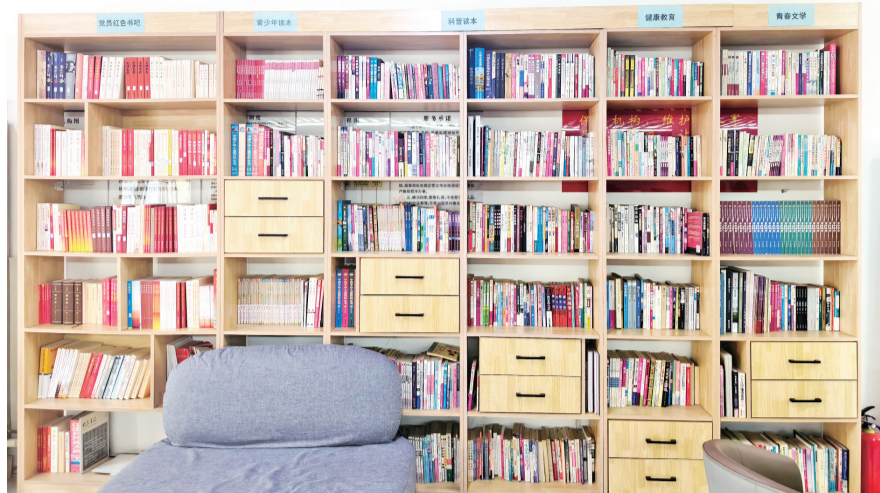
充满书香的社区书屋