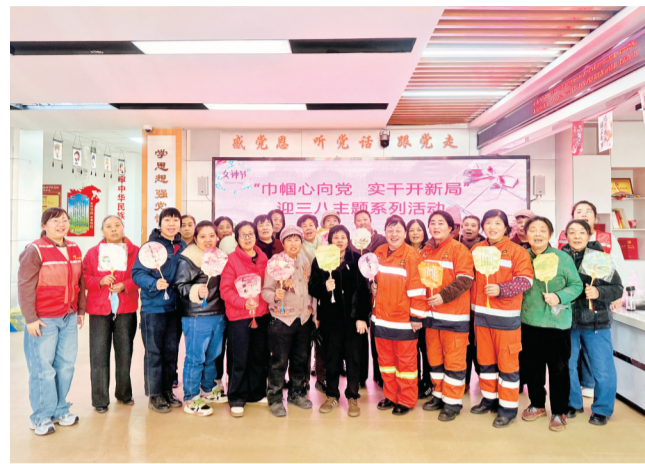
充满趣味的主题阅读活动

从银发老耆到热血青年,从邻里闲谈到思想碰撞,社区书屋正成为连接社区居民的精神纽带。下一步,建设社区将持续深化全民阅读工作,不断创新活动形式,定期开展多样化阅读活动,让阅读真正融入居民日常生活,为文明社区建设注入源源不断的力量。