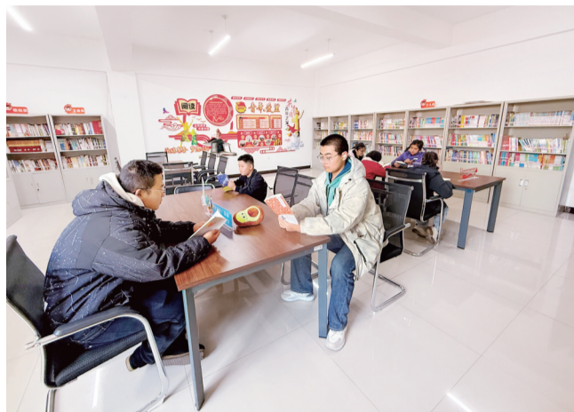
居民在社区书屋阅读

在海南区公乌素镇建设社区的社区书屋,书架上整齐排列着近2000册书籍,整间书屋散发着淡淡的书香。