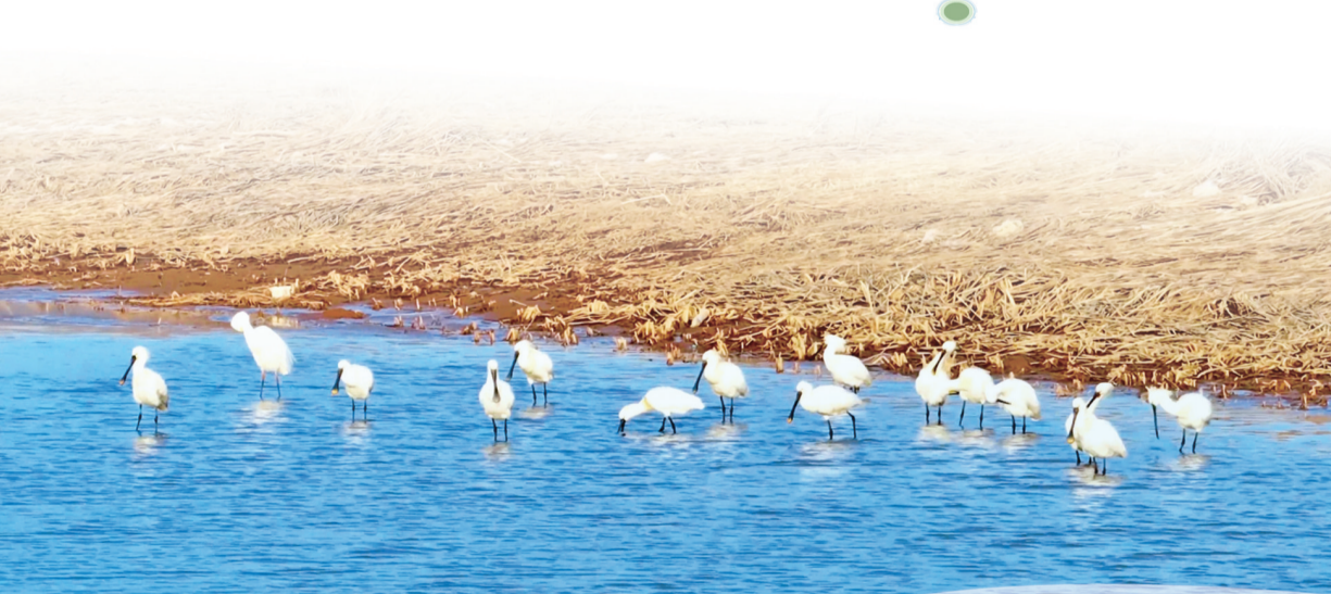
白琵鹭在浅滩涉水觅食。