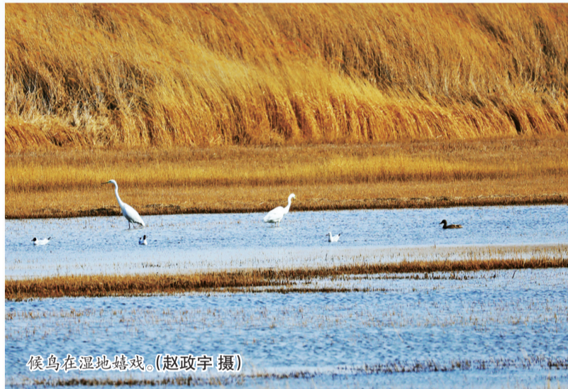
候鸟在湿地嬉戏。