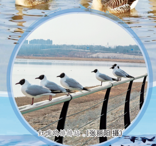
红嘴鸥排排站。