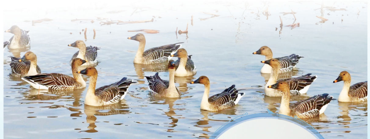
雁群游戏,绘就生态美景。