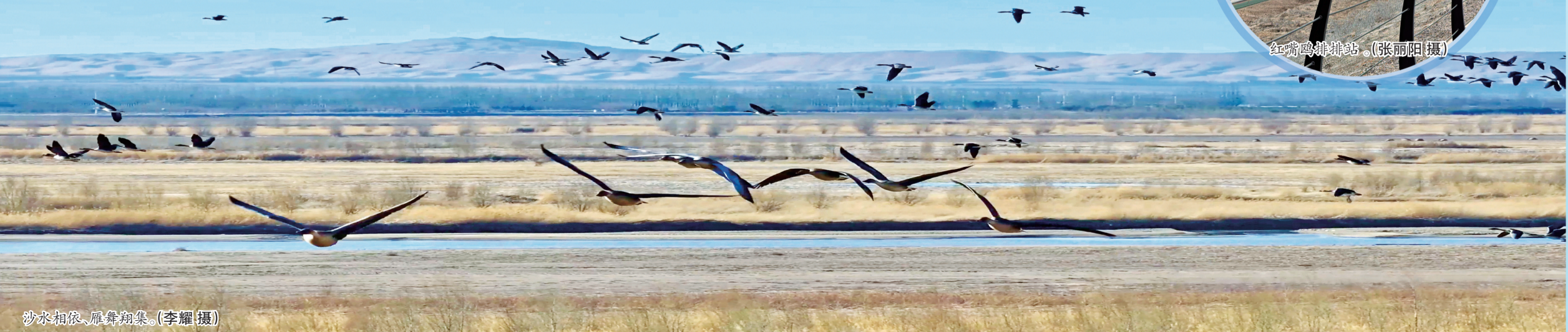
沙水相依,雁舞翔集。