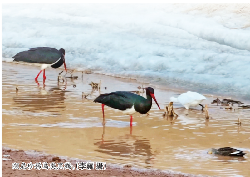
濒危珍稀鸟类黑鹳。