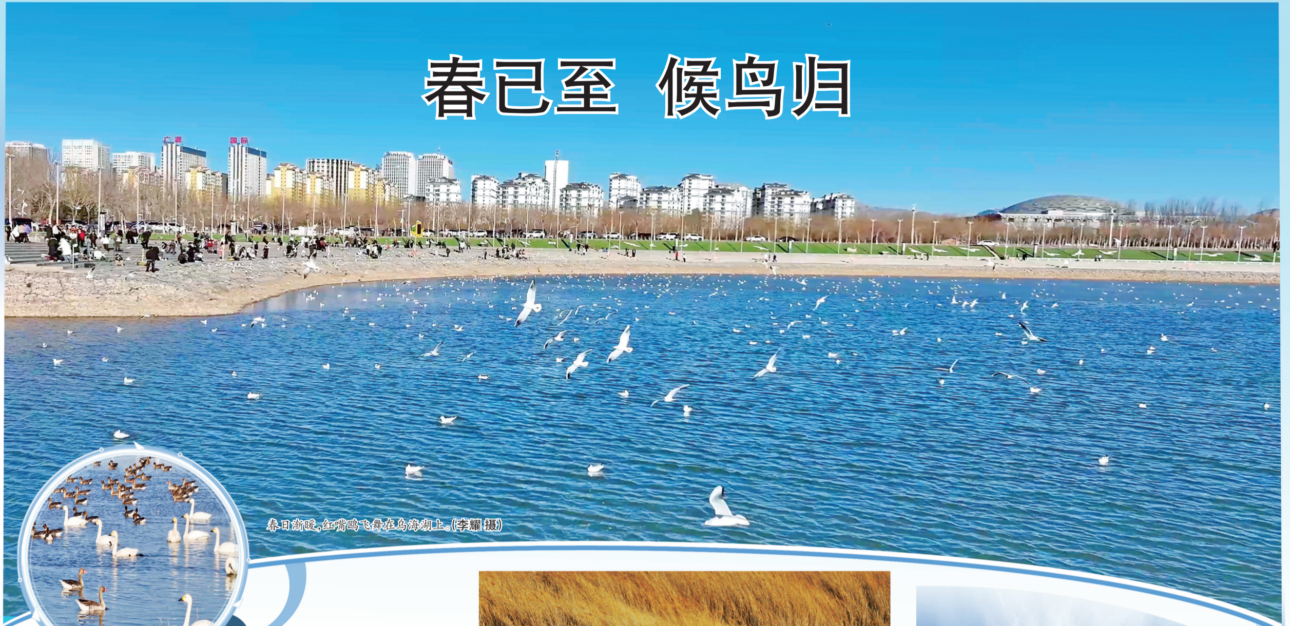
春日渐暖,红嘴鸥飞舞在乌海湖上。